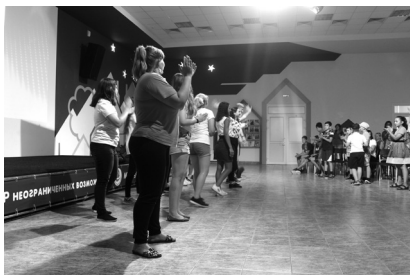
Наши – победители лагерного конкурса танцев!!!