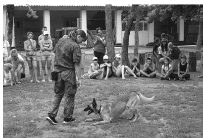
Знакомство с кинологами