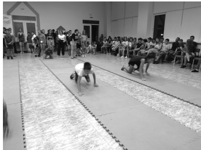
Подвижные аттракционы, эстафеты

Несомненно, нужно проанализировать и подвести итоги этого первой лагерной смены детей больных диабетом. Но, уверенно можно сказать, что «перый блин» оказался вкусным и отдыхать наши дети в лагере будут! А мы в «Мире» и всем «миром» будем учить любимых, самых лучших детей наших ЖИТЬ! Будем учить самоутверждаться. Жить с диабетом для собственного счастья, для блага Родины.