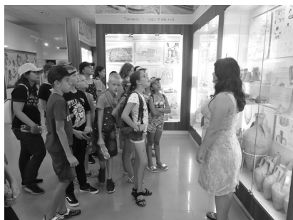
Экскурсия в Танаис

побеседовали с волонтерами и водителями, врачами, руководством лагеря, откорректировали кое-какие моменты. А уезжая задали детям последний вопрос: «Кто из вас захочет приехать в лагерь «Мир» на следующий год?» Все подняли по две руки и по две ноги и радостными голосами прокричали: «Я!!!!!!!»