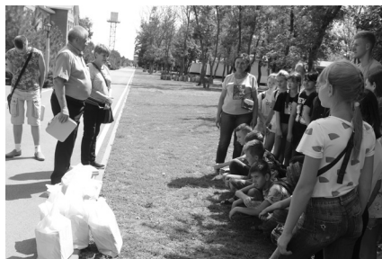
Начало смены. Приветствие и подарки от Ростовского областного диабетического общества