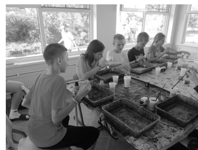
Ежедневные кружки «Умелые руки»