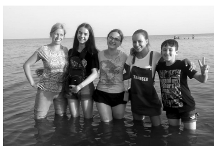
Нам Азовское море по колено