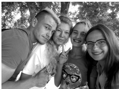
Вот такие они, волонтеры!!!