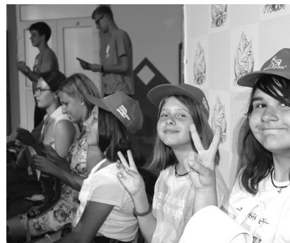
Вот вам результат отдыха!

побеседовали с волонтерами и водителями, врачами, руководством лагеря, откорректировали кое-какие моменты. А уезжая задали детям последний вопрос: «Кто из вас захочет приехать в лагерь «Мир» на следующий год?» Все подняли по две руки и по две ноги и радостными голосами прокричали: «Я!!!!!!!»