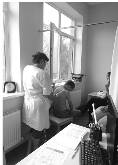
Ежедневные медицинские процедуры,