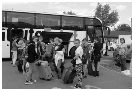
Наконец то приехали!!!

В середине лагерной смены мы провели наших детей. Нам было интересно: как же молодое поколение живет без родителей, не обижают ли их, сыты ли, вдоволь ли отдыхают, может нужно чем-то помочь. Мы посмотрели их быт, побывали на медицинских процедурах,