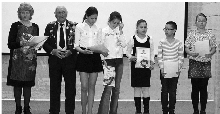
Победители конкурса детского рисунка «Салют победы»

Практически с каждым участником семинара – о личном, наболевшем